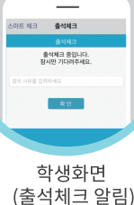
학생화면 (출석체크 알림)